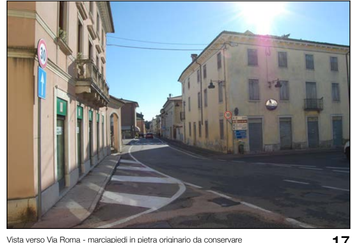
17 Vista verso Via Roma - manufatti in pietra originari da conservare