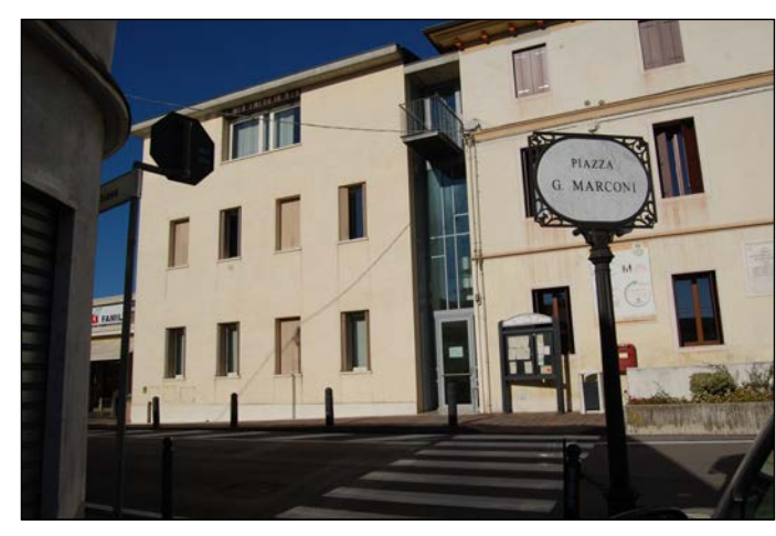
03 Ingresso uffici comunali