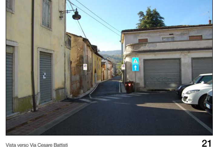
21 Vista verso Via Cesare Battisti