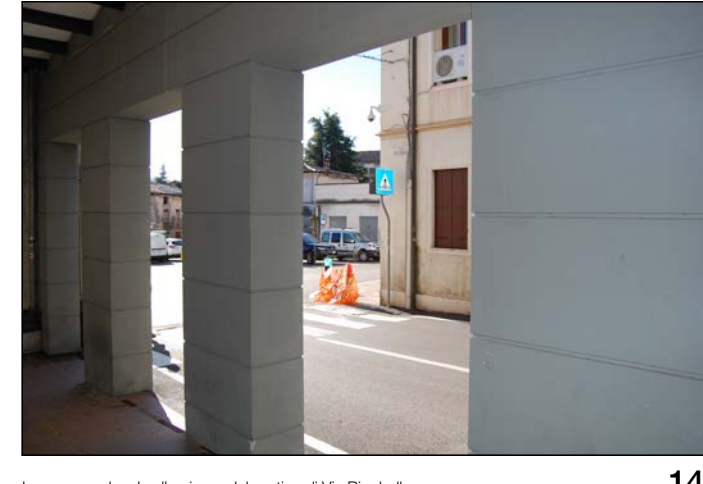
14 Ingresso pedonale alla piazza dal portico di Via Rigobello