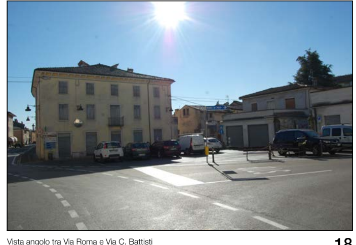
18 Vista angolo tra Via Roma e Via C. Battisti