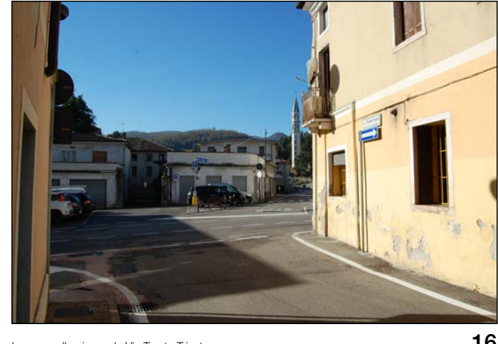
16 Ingresso alla piazza da Via Trento Trieste