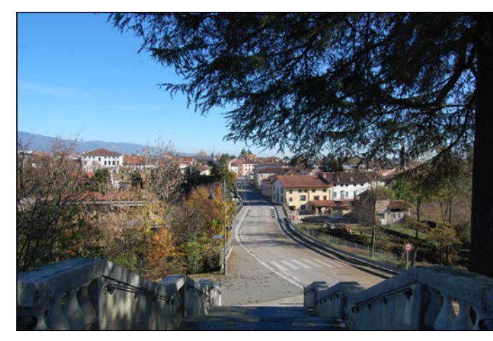
01 Vista della chiesa parrocchiale dei Santi Vito Modesto e Crescenzia