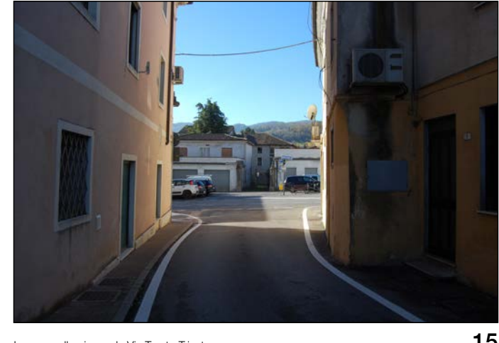
15 Ingresso alla piazza da Via Trento Trieste