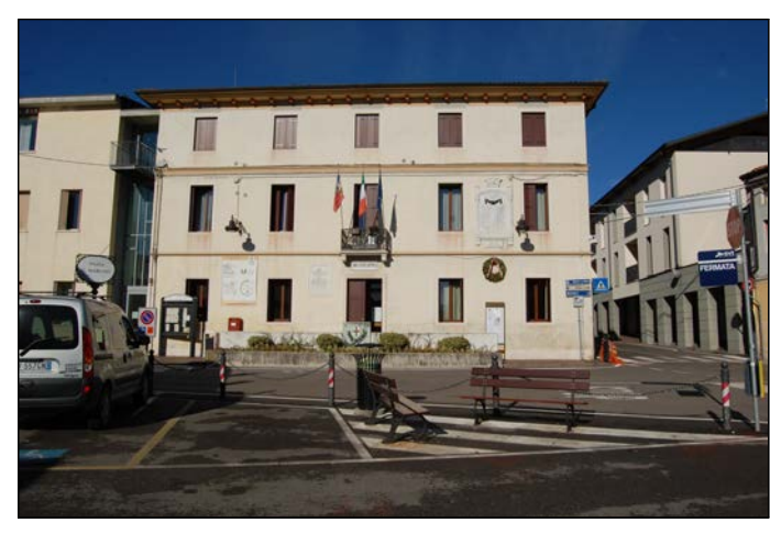
04 Ingresso principale del municipio