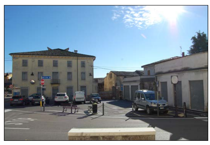
06 Vista dall'ingresso principale del municipio