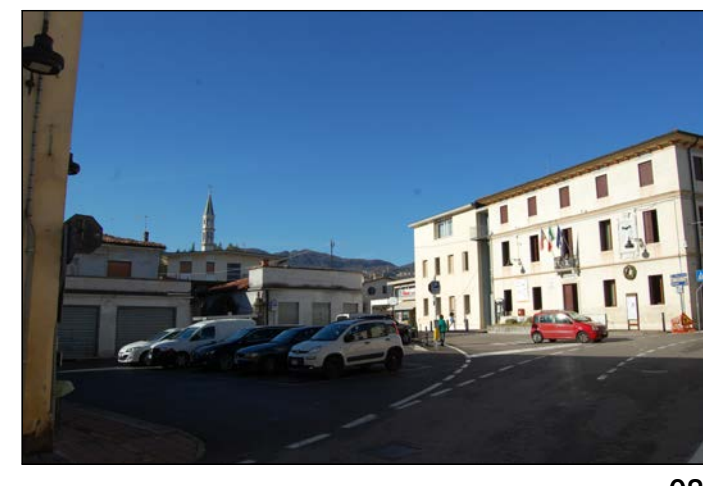
08 Ingresso alla piazza da Via Roma