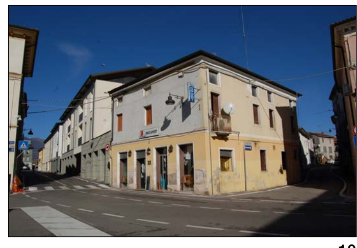
10 Vista dal centro della piazza angolo Via Rigobello - Via Trento Trieste