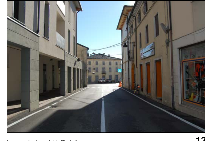
13 Ingresso alla piazza da Via Rigobello