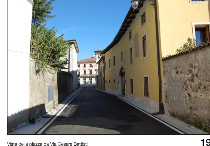
19 Vista della piazza da Via Cesare Battisti