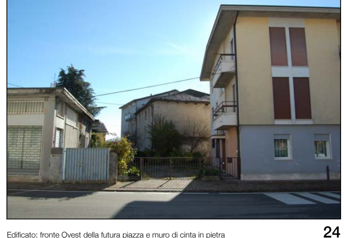
24 Edificio: fronte Ovest della futura piazza e muro di cinta in pietra