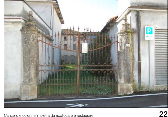
22 Carriolo e colonne in pietra da riciclare e restaurare