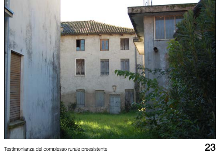
23 Restimonia di del complesso rurale preesistente