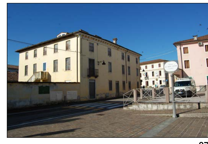
07 Vista da Piazza del Borgo Vecchio