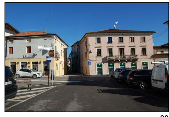
09 Vista dal centro della piazza verso Via Trento Trieste