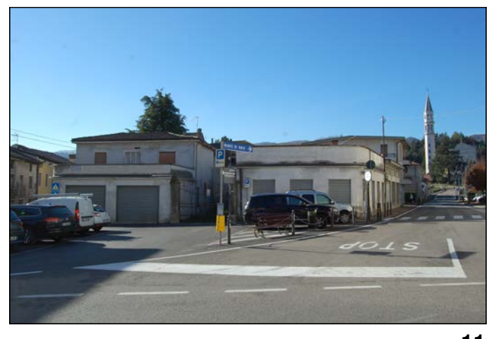
11 Vista verso Ovest - edifici oggetto di esproprio e demolizione