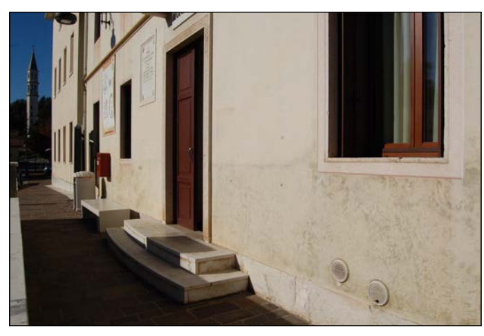
05 Ingresso principale del municipio - sullo sfondo campanile della chiesa parrocchiale