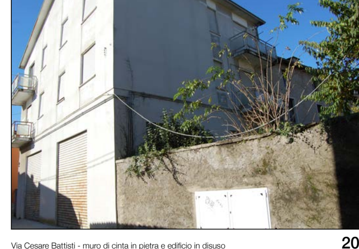
20 Via Cesare Battisti - muro di cinta in pietra e edifici in disuso