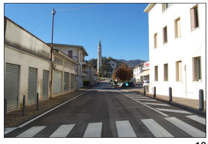
12 Vista della chiesa parrocchiale dei Santi Vito Modesto e Crescenzia