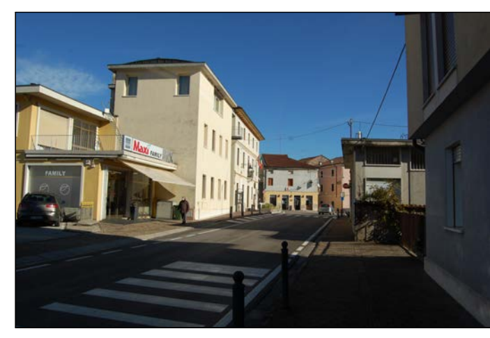
02 Ingresso alla piazza da Via Chiesa